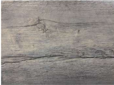
EL 2943 AMERICAN DRIFTWOOD

Marque su propio estilo con la fuerza del nogal o la nobleza del roble y goce de interiores rústicos en armonía con la naturaleza. Tonos blancos o grises, a la vez modernos y cálidos que amplían los espacios y dan mucha luz.