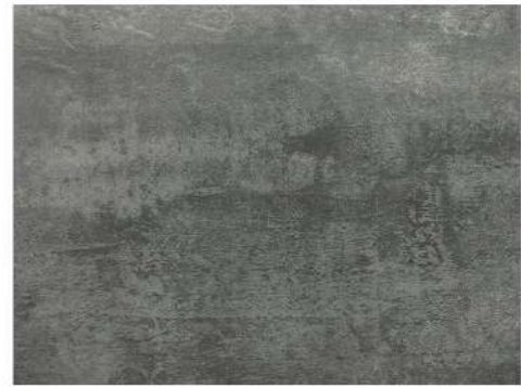
EL 2402 URBAN CONCRETE