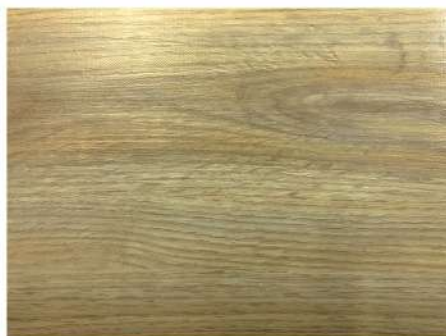
EL 2731 NATURAL OAK