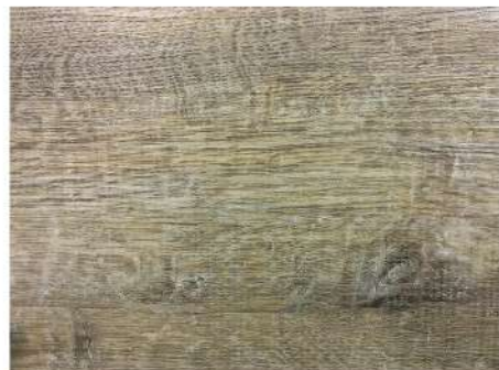
EL 2948 ANTIQUE BEIGE OAK