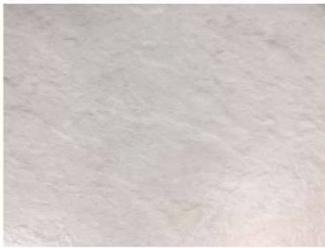
EL 2421 MOUNT WHITE SLATE

La colección Mineral es la perfecta combinación entre el carácter fuerte de las piedras y las ventajas de los pavimentos vinílicos: resistencia, limpieza sencilla, calidez.