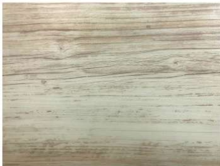
EL 2439 SCANDINAVIAN PINE