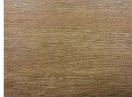
EL 2910 CANADIAN MAPLE