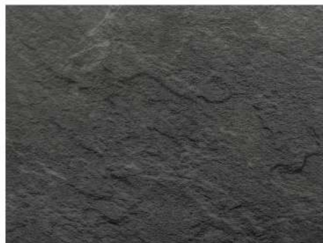
EL 2422 BRAZILIAN BLACK SLATE