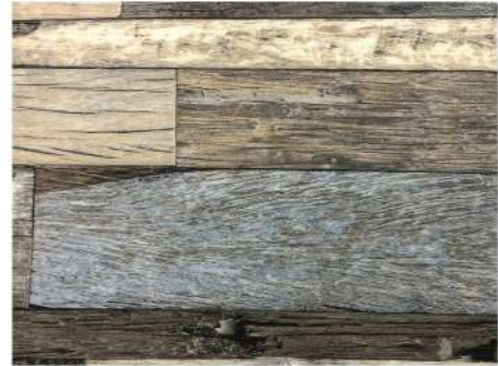
EL 2965 FRENCH VINTAGE OAK