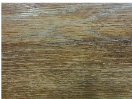
EL 2952 BROWN ASH