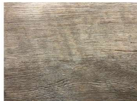
EL 2442 BROWN AMERICAN WALNUT