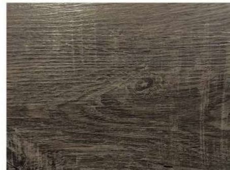
EL 2937 CHOCOLATE OAK