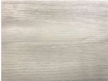
EL 2832 WHITE OAK