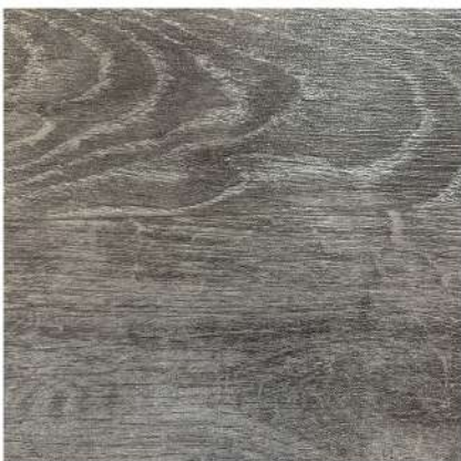
FU 4880 STORM GREY OAK