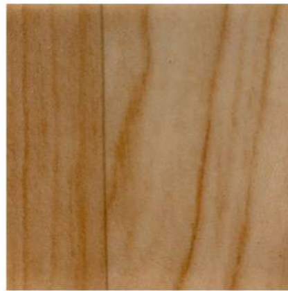
FU 4720 GOLDEN OAK