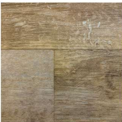
FU 4890 BEIGE OAK