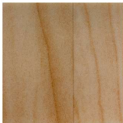
FU 4710 LIGHT GOLDEN OAK