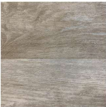
FU 4870 SILVER OAK

Se recomienda utilizar Fusion Wood en las siguientes áreas: Edificios públicos, oficinas, tiendas, colegios, guarderías, hospitales, hoteles, cafeterías y zonas de mucho tránsito.