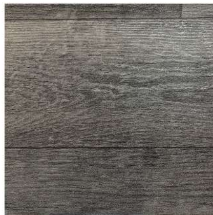
FU 4860 DARK GREY OAK