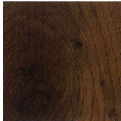
FU 4180 COPPER OAK